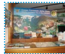
Punto informazioni Centro Visita