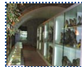
Teche del Museo della Fauna