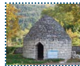
Capanna in pietra a secco

La Lontra, regina delle acque, è una straordinaria indicatrice dello stato di salute dei fiumi: se c'è lei, l'ambiente è sano.